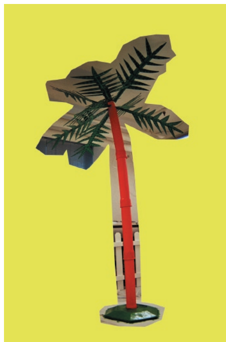
Alle bilder: Sabina Jacobsson © 2005

Sabina Jacobsson er en svært aktiv billedkunstner. I tillegg til egen kunstnerisk praksis er hun en av ildsjelene bak Galleri Uten Navn og hun underviser ved Oslo Kunstfagskole. Hun har mottatt en rekke stipend, og er innkjøpt av både Norsk Kulturråd og Göteborgs Konstråd. Utstillingen i nordic art info er støttet av Norsk Kulturfond. (For mer om Jacobsson, se vedlagte cv.)